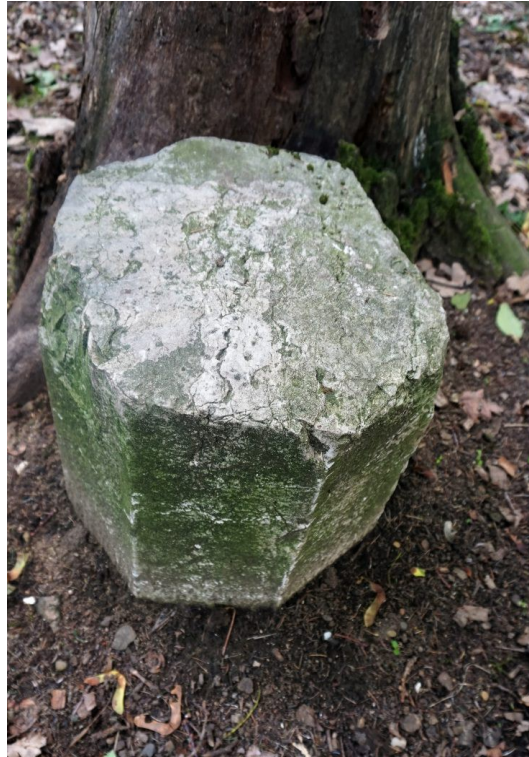
* Borne de servitude et borne de propriété Batterie de Parilly _ GC -AFDB