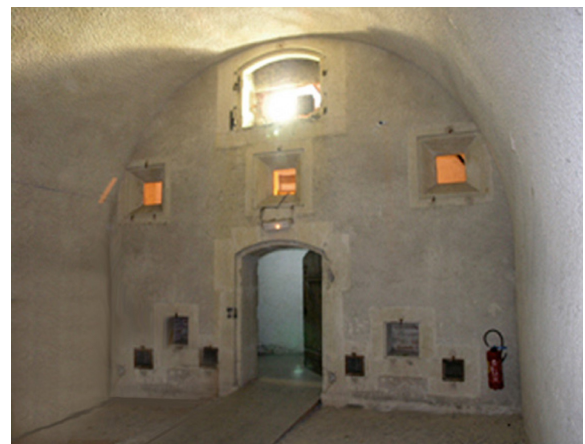
Magasin à poudre au Fort de Bron