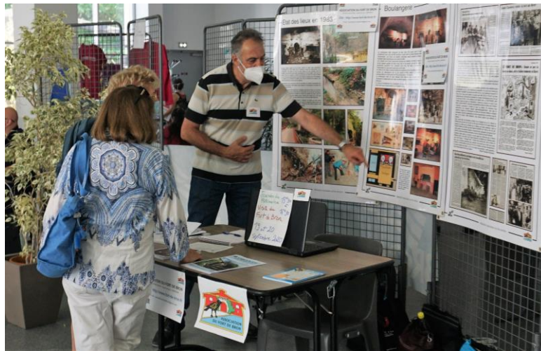
Forum des associations du 12 septembre

Des prises de contact qui devraient se concrétiser par plusieurs adhésions à l'association.