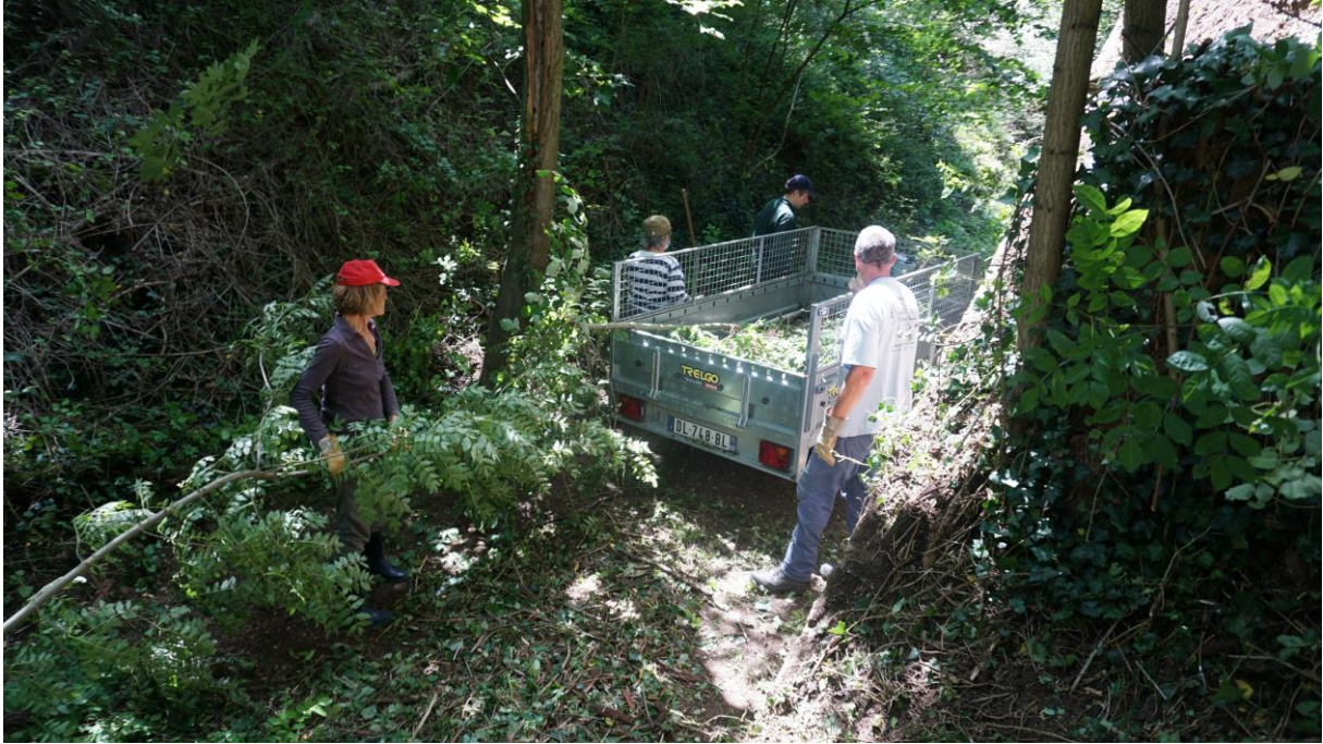
L'équipe sur la crête basse