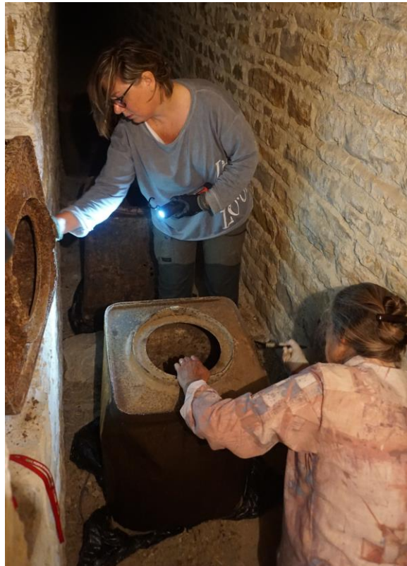
Les caisses à poudre dans la galerie