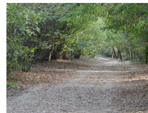
Dans le bois de Feuilly

• Comité de la randonnée pédestre du Rhône et Métropole de Lyon : 39 rue Germain, 69006 Lyon, 04 72 75 09 02, rhone@ffrandonnee.fr, rhone.ffrandonnee.fr.