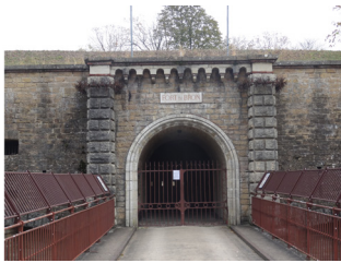
L'entrée du fort de Bron