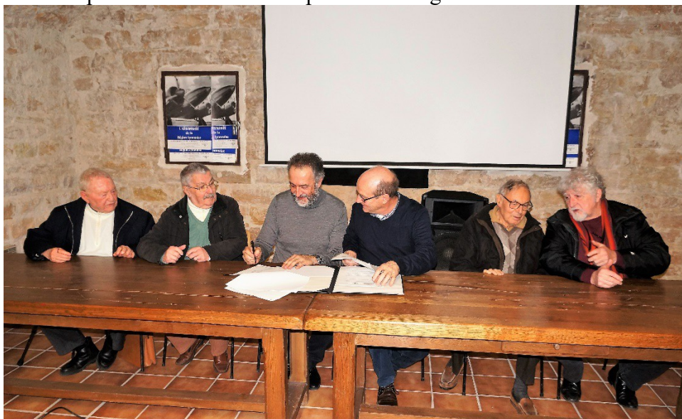
La signature de la convention M. le Maire et les cinq présidents successifs

La présence des 4 anciens présidents de l'Association du Fort a été fort remarquable. L'après-midi s'est clôturée par des échanges autour d'un buffet.